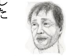
河内市長 河内長野

昨年のウォークラリーは悪 天候で、心配を抱きながら雨 の降る中の開催となりました 。グラウンドのコンディショ ンも悪く、急きょ場所を変更 して行いました。そんな中、 帰り際に参加者の方から「今 日は開催してくれてありがとう ！」と声をかけて貰いました。 活動に関して反省や、改